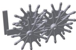
СМЕ-90.600 Секция бороны пятидисковая m = 15,3 кг.