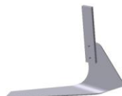
Н.043.01.020-19 Стойка с лапой левой m = 1,37 кг.