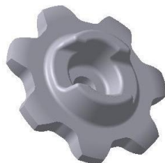
УСМК-5,4В.07.004 Звёздочка Материал: СЧ20. m = 0,4 кг