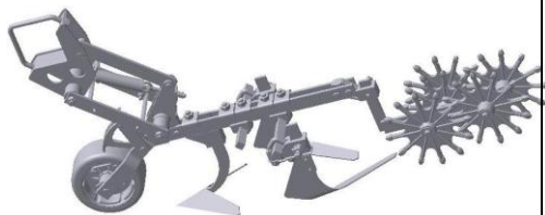
УСМК-5,4.23.000 Секция m = 42 кг.