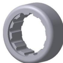
ТУ 381045-81 Шина 230x100