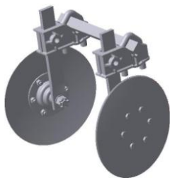
УСМК-5,4.23.100 Защитные диски m = 10,12 кг.

Примечание: В комплект поставки секции, рабочие органы не входят. *Опция, поставляется по заказу покупателя.