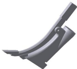
СМЕ-90.500 Нож подкормочный m = 5,42 кг.