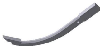
Н.043.08.110 Лапа рыхлителя долотообразная m = 1,44 кг.