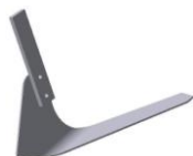
Н.043.01.010-19 Стойка с лопой правой m = 1,37 кг.