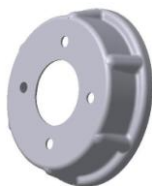
УСМК-5,4В.03.018 Обод наружный Материал: ОК360. m = 0,58 кг.